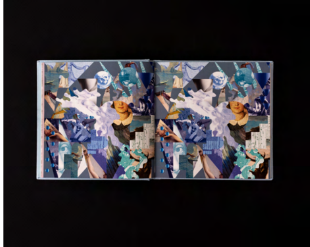
E S Kibele Yarman, The Importance of an Afternoon Nap at the Paperwork Hotel, 2022